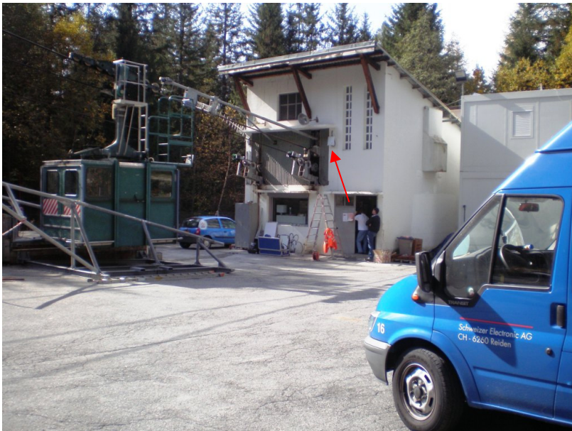
Talstation mit Richtfunkantenne (Pfeil), Transportgondel

Chamonix ist ein international renommierter Skort im Südwesten Frankreichs. Neben der touristischen Nutzung wird mit dem Schmelzwasser aus dem Mer de Glace durch die Électricité de France ( www.edf.com ) Strom erzeugt.